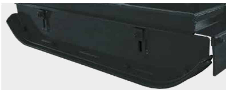
Patines laterales con chapas reemplazables y regulación de altura de corte.