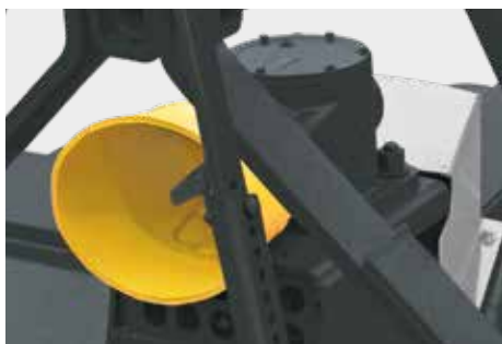
Caja multiplicadora de velocidad de giro libre.