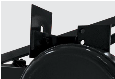
Limpiador de la rueda de profundidad.