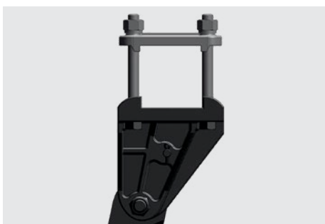
Fleje subsoladora y dispositivo de seguridad con perno fusible que se rompe al recibir grandes impactos.