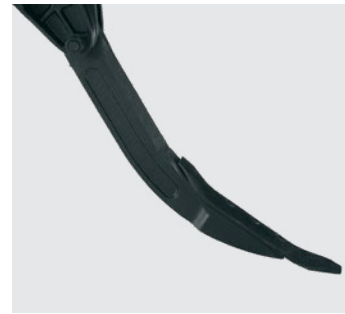
Puntas reversibles de los ejes.