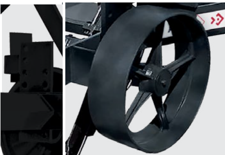
Rueda para control de profundidad regulable.